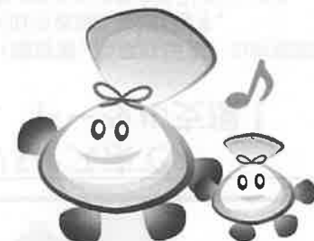
島根労働局公式キャラクター しじろう